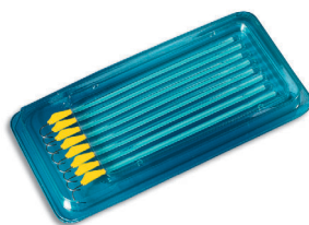
Sterilverpackung mit 8 Stück Systemhaken